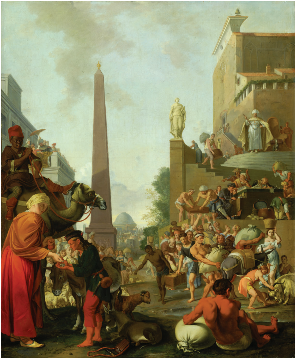
Bartholomeus Breenbergh Joseph verteilt Korn in Ägypten (1655) Öl auf Leinwand The Barber Institute of Fine Arts. Birmingham