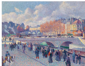
Maximilien Luce Die Seine bei der Pont Saint-Michel , 1900 Öl auf Leinwand, 89,2 x 116,2 cm Sammlung Hasso Plattner, Museum Barberini, Potsdam