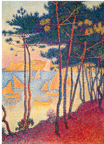
Paul Signac Segel und Pinien , 1896 Öl auf Leinwand, 81 x 52 cm Privatsammlung