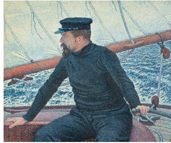
Théo van Rysselberghe Paul Signac am Steuer der Olympia , 1896 Öl auf Leinwand, 93 x 114 cm Archives Signac