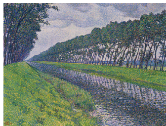
Théo van Rysselberghe Kanal in Flandern bei trübem Wetter, 1894 Öl auf Leinwand, 93 x 114 cm Privatsammlung