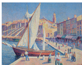
Maximilien Luce Der Hafen von Saint-Tropez, 1893 Öl auf Leinwand, 73,7 x 91,4 cm Privatsammlung