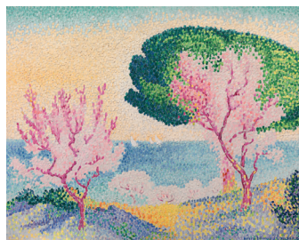
Henri-Edmond Cross Rosafarbener Frühling, 1909 Öl auf Leinwand, 73 x 92,7 cm Privatsammlung, Courtesy Richard Green Gallery, London