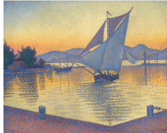
Paul Signac Der Hafen bei Sonnenuntergang, Opus 236 (Saint-Tropez), 1892 Sammlung Hasso Plattner Museum Barberini, Potsdam