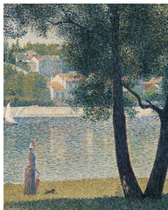
Georges Seurat Die Seine bei Courbevoie , 1885 Öl auf Leinwand, 81 x 65 cm Privatsammlung