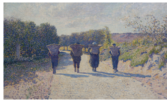
Anna Boch Rückkehr vom Fischfang, 1891 Öl auf Leinwand, 75,5 x 127 cm Privatsammlung, Belgien