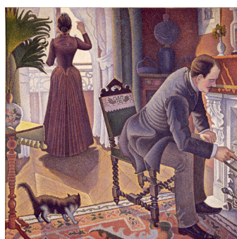
Paul Signac Sonntag , 1888-1890 Öl auf Leinwand, 150 x 150 cm Privatsammlung